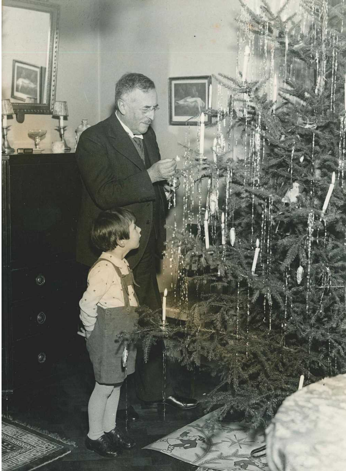
写真 - 1

以下に、各写真とその裏面の記載及びその和訳を記す。和訳は、スウェーデン在住の 靱山孝雄・グンネル夫妻による。