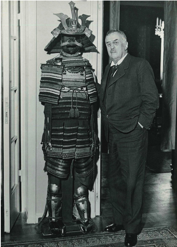
写真 - 2